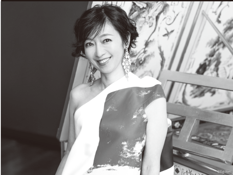
曾根麻矢子 Mayako Sone

実力、人気ともに日本を代表するチェンバロ奏者。1986年ブルージュ国際チェンバロ・コンクールに入賞後、故スコット・ロスに指導を受ける。1991年には、エラート・レーベル初の日本人演奏家としてCDデビュー。以後イスラエル室内オーケストラの専属チェンバロ奏者、現代舞踊家とのコラボレーションなど多彩な活動を開始。国内でもリサイタル、室内楽と積極的に活動し、とりわけ、2003年～09年までの6年間12回にわたるJ.S.バッハ連続演奏会が注目を集め、2010年～14年にも全12回のクーブランとラモーのチェンバロ作品全曲演奏会を行い、好評を博した。2018年、フランスで行われたスカルラッティのソナタ全555曲を演奏するフェスティバル「スカルラッティ555」に出演。その模様はラジオフランスでも放送された。2019年アサス城にて行われたスコット・ロス30周年追悼コンサートに出演。録音は「J.S.バッハ:ゴルトベルク変奏曲」ほか14枚のソロCDをリリース。出光音楽賞、飛騨古川音楽大賞奨励賞を受賞。2011年より2018年まで「チェンバロ・フェスティバル in 東京」芸術監督を務めた。2018年より「チェンバロを学ぼう!」シリーズを松本記念音楽迎賓館にてスタート。国内外の一流アーティストを招き、通奏低音やバロックダンスなどの多彩なテーマによる、演奏家ならではのレクチャーやマスタークラス等をプロデュースしている。