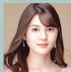
堀尾泉水 ソプラノ