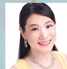
山内菜緒 ソプラノ