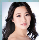
中川郁文 ソプラノ