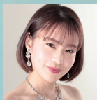
山元三奈 ソプラノ