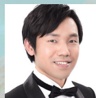
菅 康裕 テノール