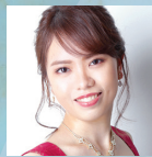
長崎真衣 メゾソプラノ