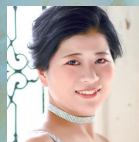
小藺江凧彩 ソプラノ