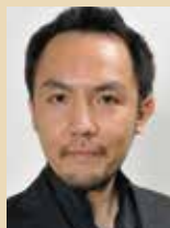
テノール 谷口洋介