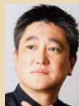
カウンター・テナー 上杉清仁