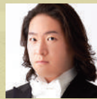
佐橋 潤 バリトン