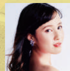
脇田つぐみ ソプラノ