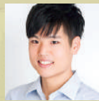
山本和之 テノール