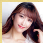
利波里奈 ソプラノ