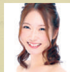
山崎愛実 ソプラノ