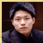
星野響介 バリトン