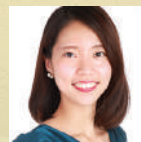
照沼小雪 ソプラノ