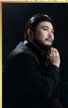
バス・バリトン 奥秋大樹