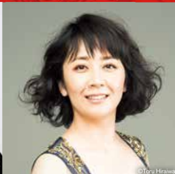
林美智子(メゾ・ソプラノ)