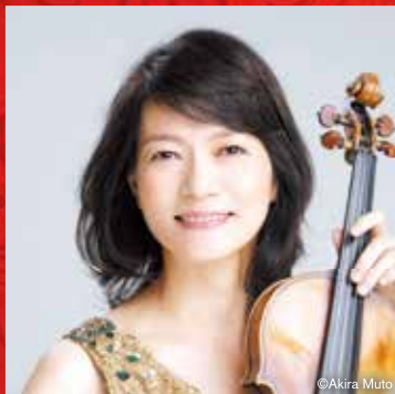
小林美恵(ヴァイオリン)