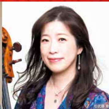
長谷川陽子(チェロ)