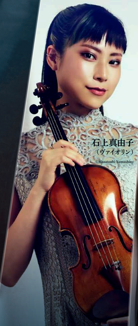
石上真由子 (ヴァイオリン)